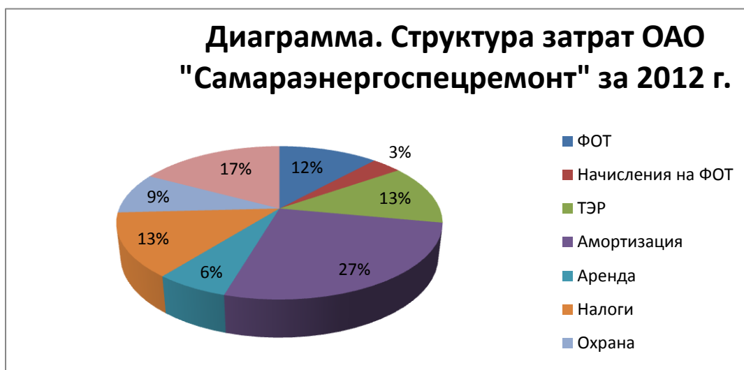
Диаграмма. Структура затрат ОАО "Самараэнергоспецремонт" за 2012 г.

Утверждение БДДС на 2012 год не проводилось, планирование БДДС происходило в соответствии с утвержденным БДР, использовалось скользящее планирование, с ежемесячными корректировками.